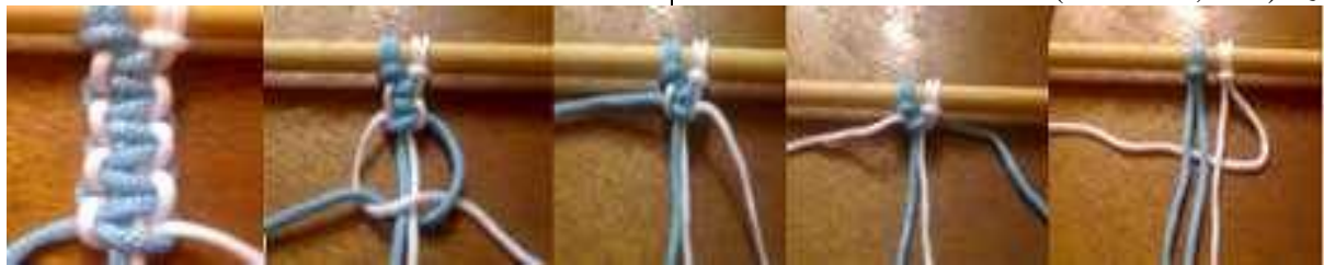
صور 2,3,4,5,6,7 توضح خطوات تنفيذ غرزة العقدة المربعة. ( http://pinterest.com )

وهي من العقد الأساسية في المكرمية وتحتاج إلى أربعة خيوط فيها الخيطان الداخليان يتشابكان مع الخيطين الخارجيين لتتكون العقدة المربعة وزخارف هذه العقدة تعطي إمكانيات متنوعة. ( http://blog.redheart.com )